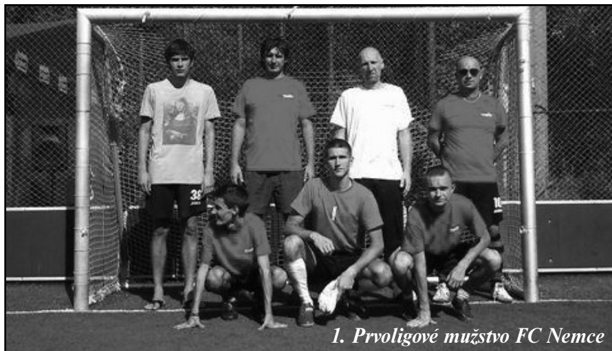
1. Prvoligové mužstvo FC Nemce