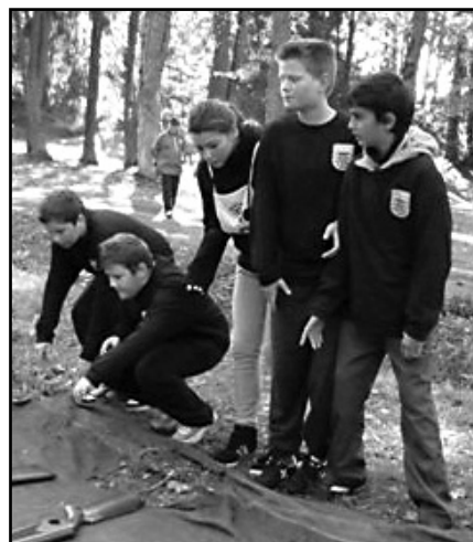
Sústredenie pred streľbou zo vzduchovky