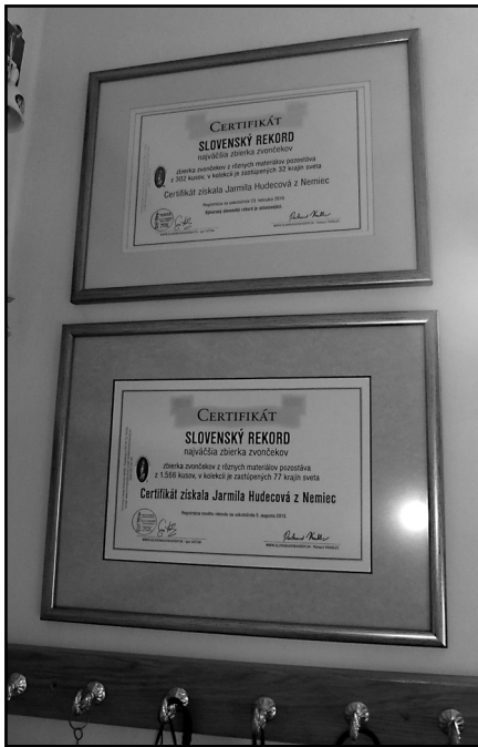
Dva certifikáty o slovenskom rekorde z rokov 2010 a 2013

čo nie je jednoduché, lebo nie všetci sa hrnú na jedno miesto v prípade napr. jarmokov. Využíva to, že ako členka dobrovoľného hasičského zboru v obci a aj v okresnom orgáne - samotný hasičský motív s logami hasičských zborov tu má široké zastúpenie, okolo 90 kusov - má