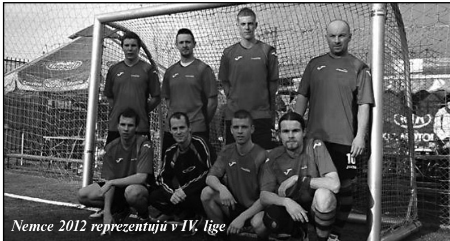
Nemce 2012 reprezentujú v IV. lige