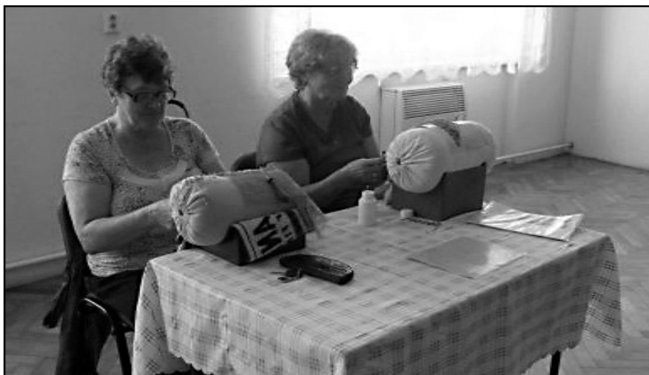
Naše paličkárky v akcii