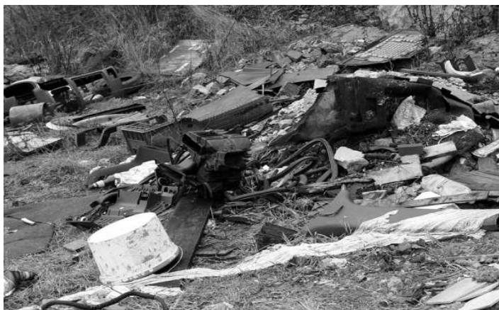
Čo dokážu ľudia v našom katastri

Druhé kolo volieb prezidenta SR bude dňa 29. marca 2014