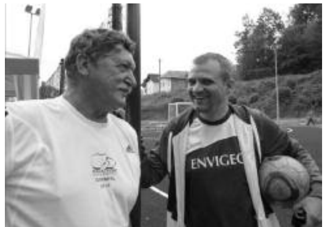
„Tak čo pán starosta, výhráme?“