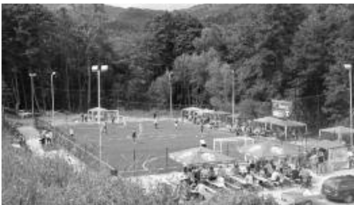
Celkový pohľad na ihrisko „na otočke“

S odstupom času môžeme zhodnotiť a celkovo turnaj vyhodnotiť ako úspešný, pretože bol „nabitý hviezdami“ nielen z ligových, ale aj extraligových mužstiev. Pamätníci a odborníci zároveň sa zhodli na tom, že Nemce ešte tak vysokú úroveň turnaja a také hviezdne obsadenie nezažili.