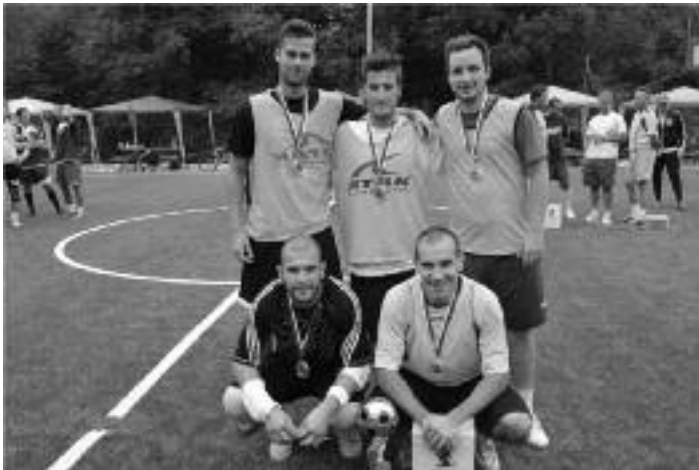
2. miesto – mužstvo Bianconeri

1.)Envigeo – 18 bodov 2.)Bianconeri – 15 bodov 3.)Nemce 2012 – 10 bodov 4.)Barumka – 9 bodov 5.)FC Nemce – 6 bodov 6.)Chelsea – 4 body 7.)Adrenalín – 0 bodov