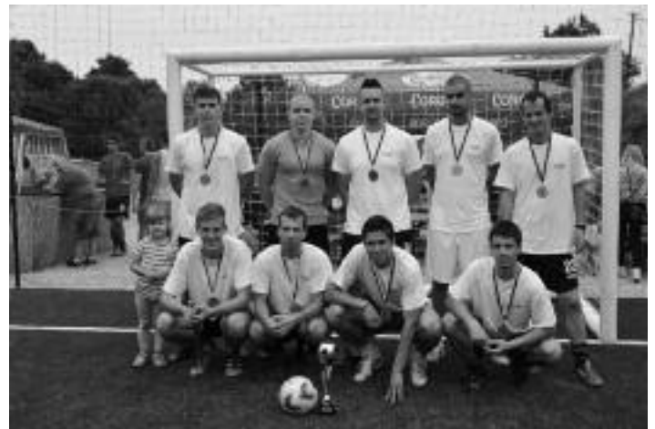
3. miesto – Nemce 2012