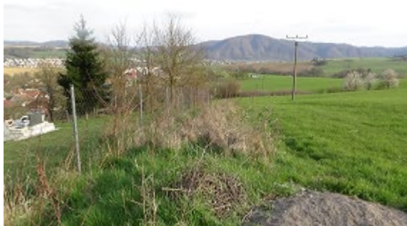
Stav zo dňa 27.4.2021

Komisia navrhuje zvážiť použitie chemickej ochrany, proti zarastaniu popínavou rastlinou.