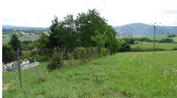
Stav zo dňa 19.8.2021