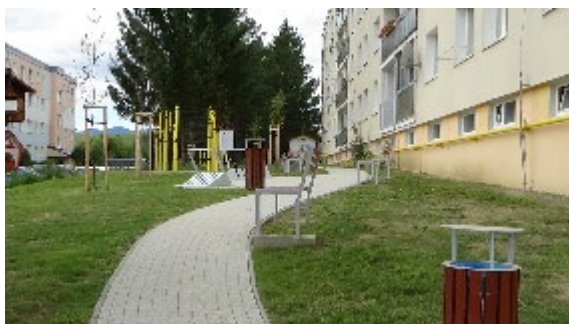
Stav zo dňa 19.8.2021