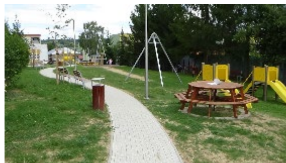
Stav zo dňa 19.8.2021