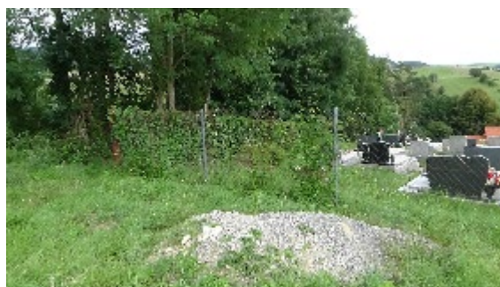
Stav zo dňa 19.8.2021

Napriek vyčisteniu oplotenia toto opätovne začalo zarastať popínavou rastlinou.