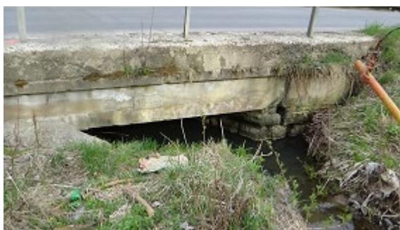
Stav mosta zo dňa 27.4.2021

Komisia navrhuje vyzvať FIT FAKTORY o očistenie cesty a vykonať nápravy proti odplavovaniu štrku z parkoviska.