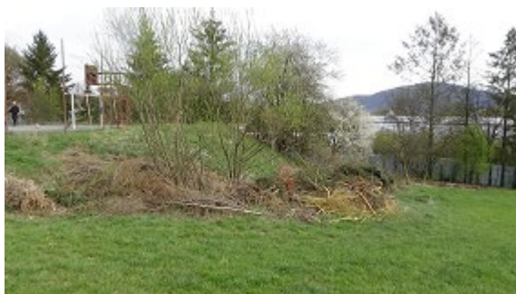
Prostredie príľahlých priestorov pod ihriskom zo dňa 27.4.2021