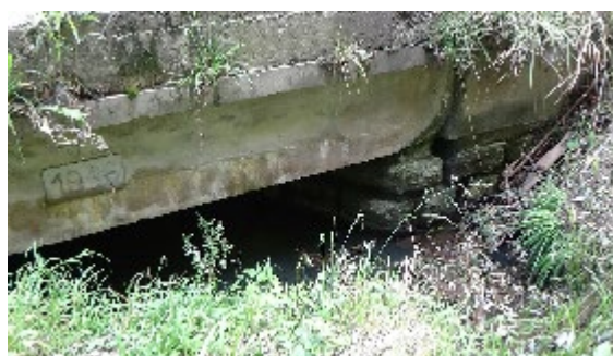
Stav mosta zo dňa 19.8.2021

Priepustnosť mosta sa nezmenila. Ohrozená je aj statika mostného telesa.