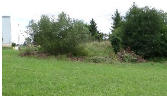
Prostredie dňa 19.8.2021. Bolo konštatované, že je tu viacej odpadu ako dňa 27.4.2021

Komisia opätovne ako v zápisnici zo dňa 27.4.2021 navrhuje konáre za ihriskom podrvíť. Svah pokosiť a štiepku rovnomerne rozprestrieť po svahu.