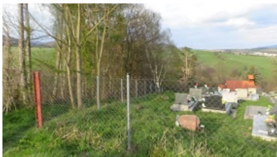
Stav zo dňa 27.4.2021