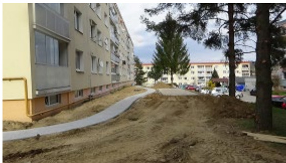
Stavba revitalizácie vnútrobloku zo dňa 27.4.2021