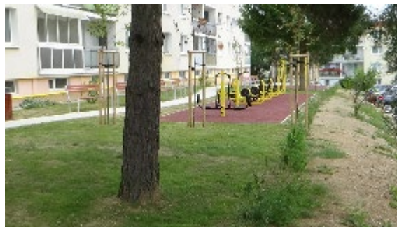
Stav zo dňa 19.8.2021