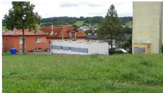
Stav zo dňa 19.8.2021