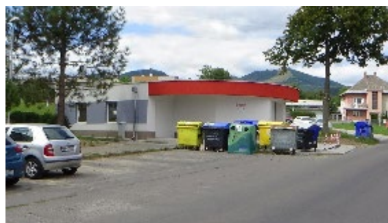
Stav zo dňa 19.8.2021