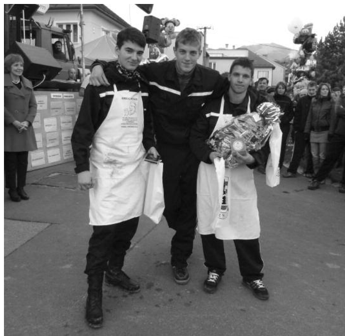
3. miesto za zabíjačkový tanier pre Hasičov z Nemiec