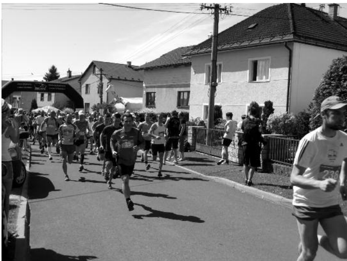
Pelotón bežcov krátko po štarte