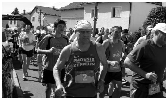
Nemčiansky beh muži