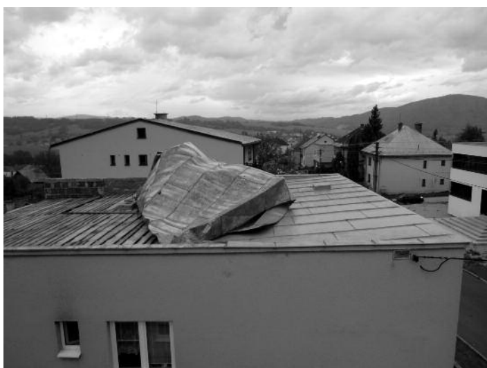
Strecha RD L. Kostiviara na Lúčnej ulici