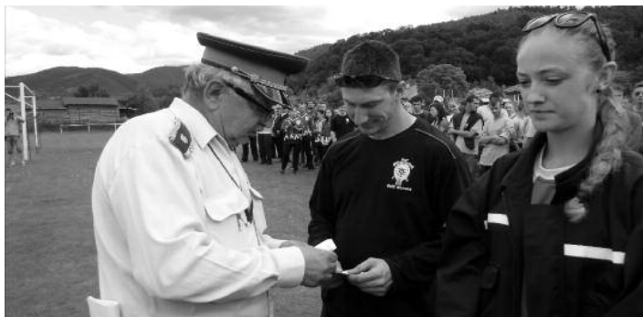
V múzeu hasičskej techniky, Martin apríl 5 2014