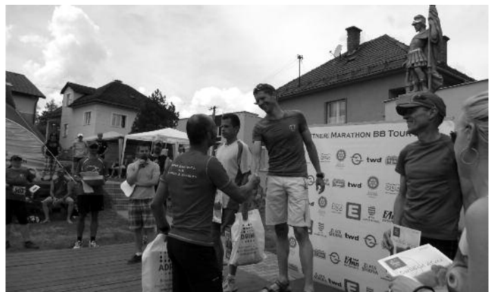
Najlepší na stupni víťazov beh na 10 km kategória muži do 40 r.