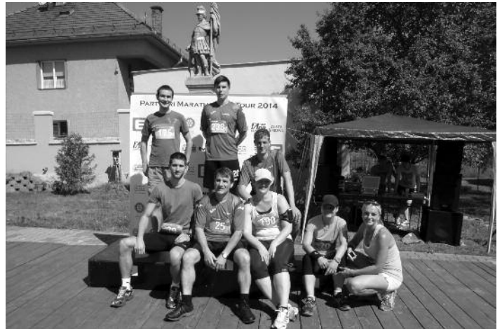
Reprezentanti Nemiec na Adrim Nemčiansky beh