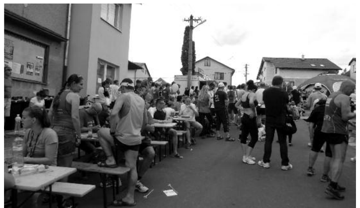
Po namáhavom behu pochutil bežcom dobrý nemčiansky guláš