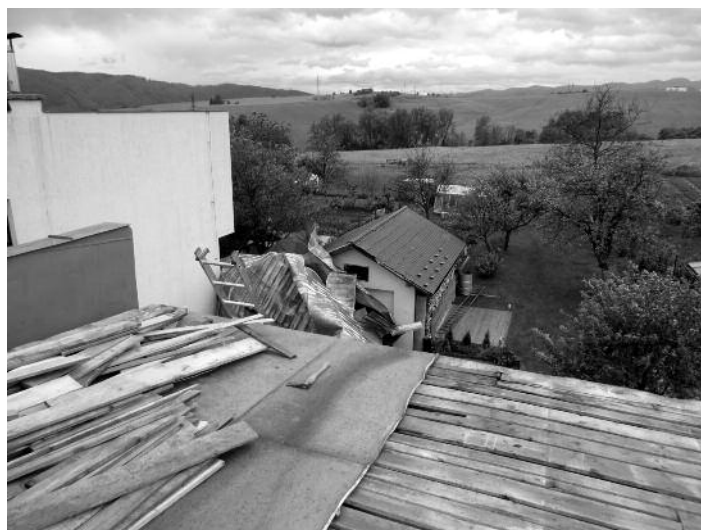
Zrolovaná strecha RD E Kostiviarovej na Lúčnej ulici